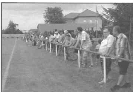
Diváci na zápase SK Velké Přítočno

Přesto Vás všechny rádi uvidíme osobně při soutěžních kláních našich týmů přímo u nás v areálu fotbalového hřiště, který se v rámci postupně prováděné rekonstrukce začíná rýsovat do svého finálního „nového“ vzhledu.