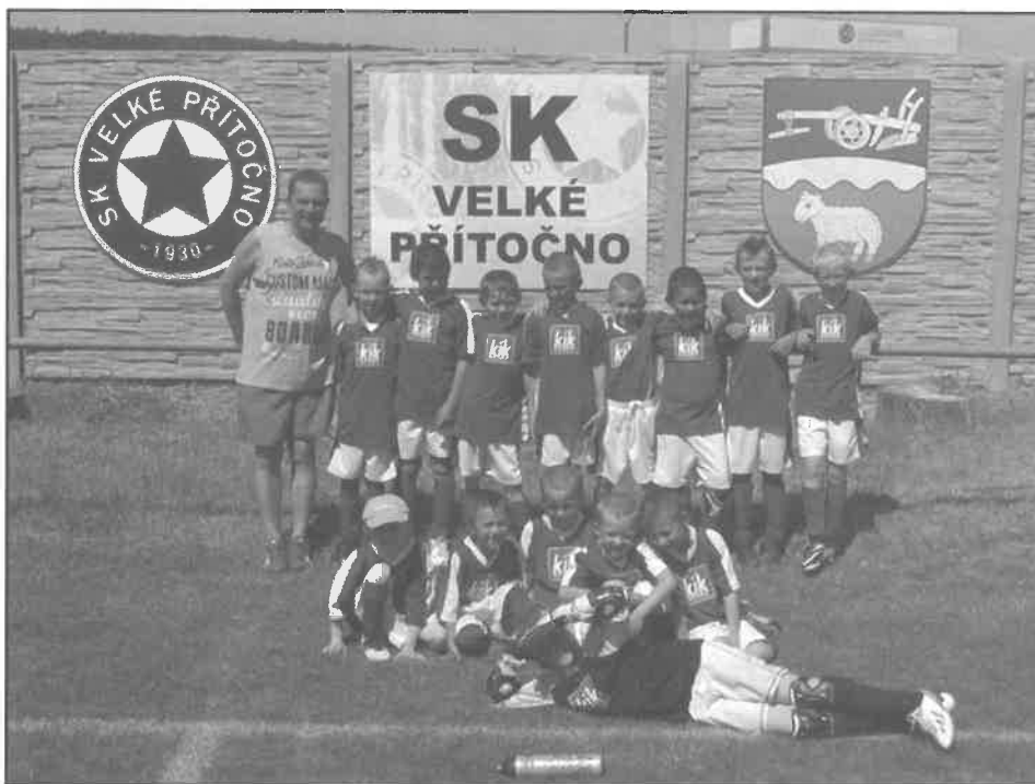
Přípravka SK Velké Přítočno

Koho by přeci jen zajímaly výsledky jednotlivých zápasů přípravy, je možné si je prohlédnout na našem